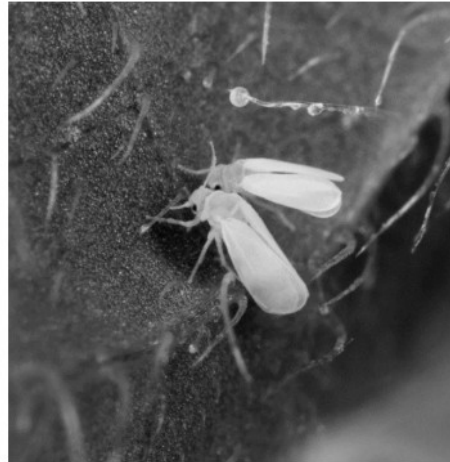
Aleurodes du tabac adultes, suçant la sève d'une feuille (taille : entre 1 et 3 mm de long)

L'aleurode du tabac ( Bemisia tabaci ) est un insecte qui se répand actuellement de manière importante dans de nombreuses régions du monde. Cet insecte suce la sève de plusieurs familles de plantes cultivées : cucurbitacées, fabacées, malvacées ou liliacées par exemple. Les dégâts occasionnés sont nombreux : déformation des feuilles, prolifération de champignons ou encore vecteur de virus.